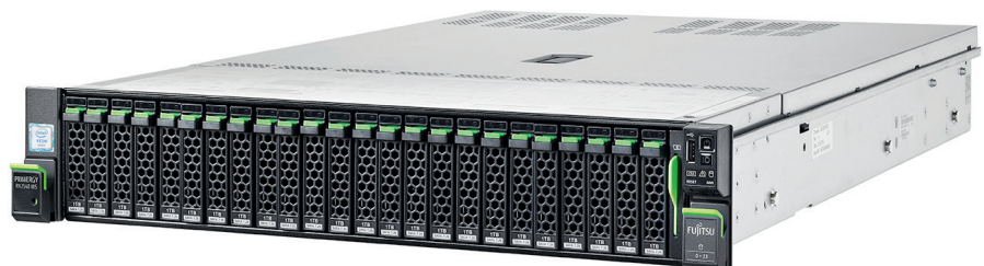
Fujitsu PRIMERGY RX2540 M5